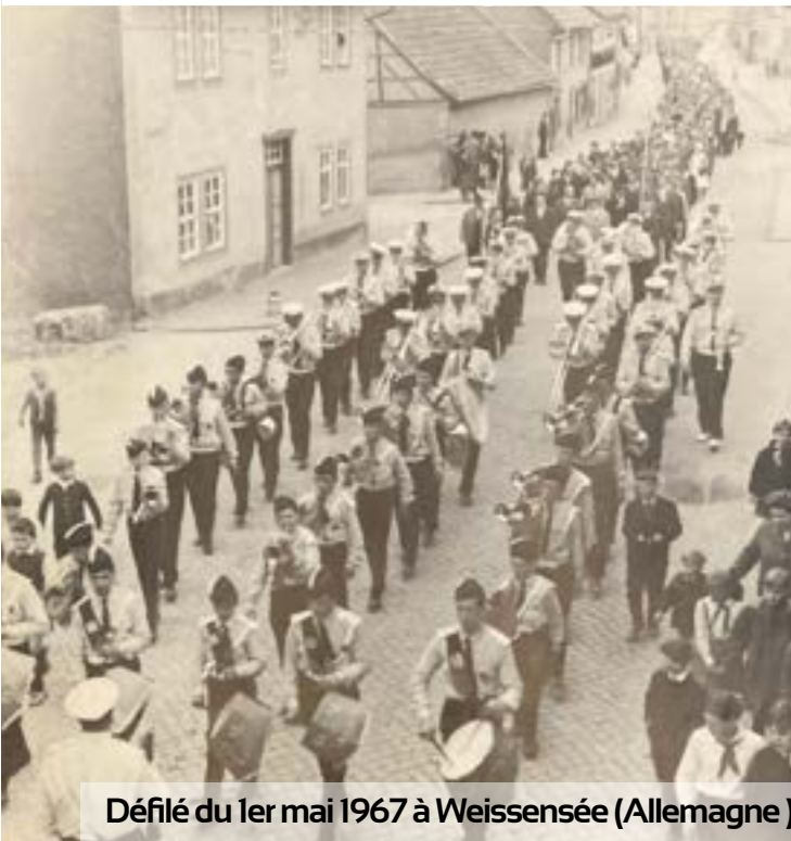
Défilé du 1er mai 1967 à Weissensée (Allemagne)

Il est très difficile de pouvoir dater précisément l'ensemble de ces photographies. Seule, celle représentant le défilé du 1er mai 1967 à Weissensée (photo en bas à gauche) comporte une date.