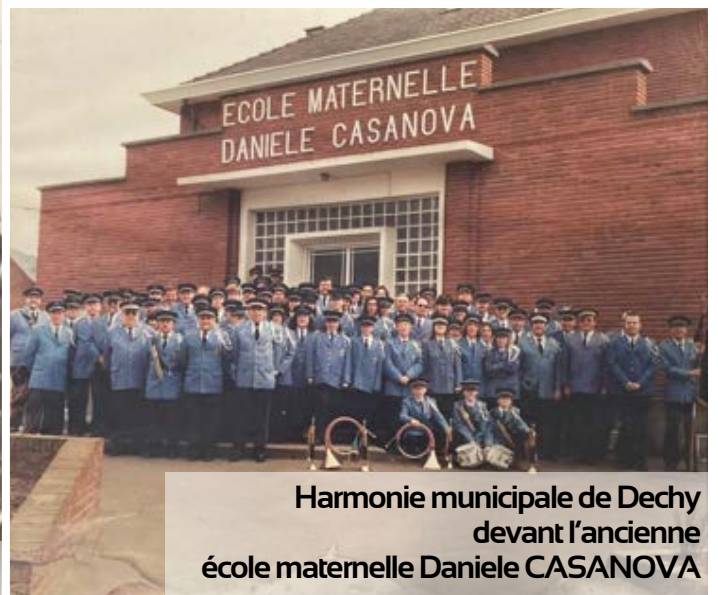
Harmonie municipale de Dechy devant l'ancienne école maternelle Daniele CASANOVA

Il est très difficile de pouvoir dater précisément l'ensemble de ces photographies. Seule, celle représentant le défilé du 1er mai 1967 à Weissensée (photo en bas à gauche) comporte une date.