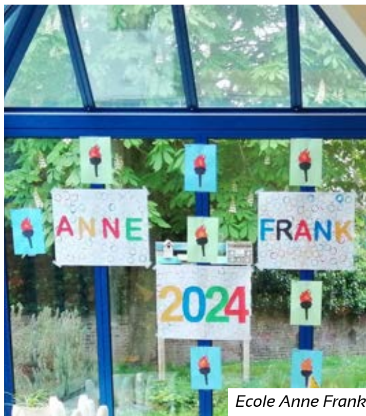
Ecole Anne Frank

Les élèves de nos deux écoles maternelles ont été ravis de présenter leurs très belles expositions vendredi 7 juin.