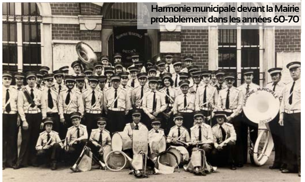
Harmonie municipale devant la Mairie probablement dans les années 60-70