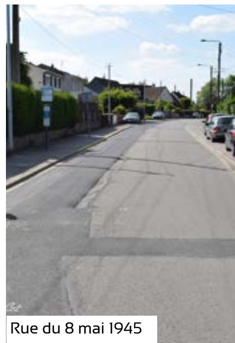
Rue du 8 mai 1945