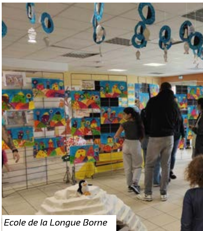
Ecole de la Longue Borne