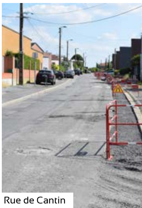
Rue de Cantin

Rappelons que ces travaux sont effectués pour l'ouverture de fouilles et terrassement en chaussée et en trottoir pour la pose de réseau souterrain HTA 240 2 AL pour injection du parc éolien du Moulin pour le compte d'ENEDIS.